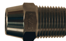
Acero inoxidable global