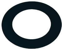
Acero al carbón