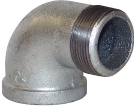
Hierro galvanizado 150#