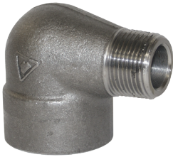
Acero forjado 3000#