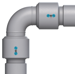
Hembra NPT x hembra NPT