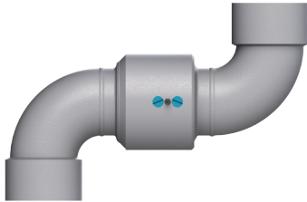
Hembra NPT x hembra NPT