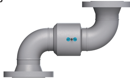
Brida ASA 150# x Brida ASA 150#