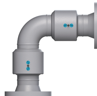
Brida ASA 150# x Brida ASA 150#

Configurador de juntas giratorias disponible dixonvalve.com