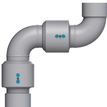
Hembra NPT x hembra NPT