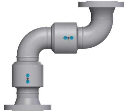
Brida ASA 150# x Brida ASA 150#