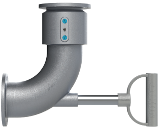
Estilo 30, radio largo