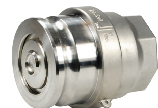
Adaptador x 3" hembra NPT