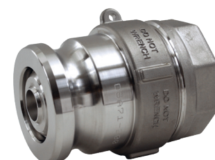
Adaptador x 1 1/2" y 2" hembra NPT