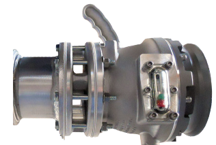
5200-SFI montado en tanque