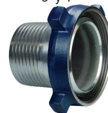
6" y 8"