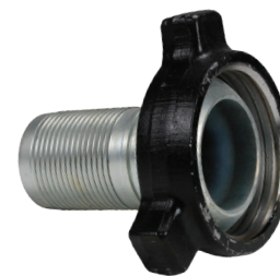
3" y 4"