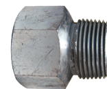
Hembra NPT x Rosca tuerca