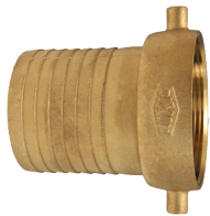
Hembra con rosca NPSM