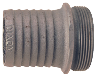
1" - 2½"