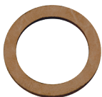
Empaque de cuero