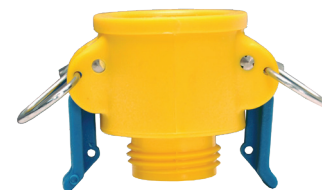
Acople hembra x macho GHT