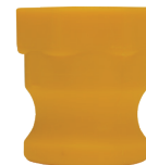
Adaptador macho x hembra GHT