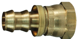
Tapa de latón