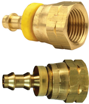
Tapa de latón