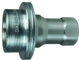
Acero inoxidable 303