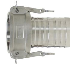
Acero inoxidable 316 de fundición revestida