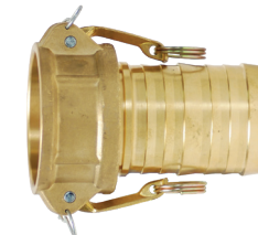
Latón forjado C38000