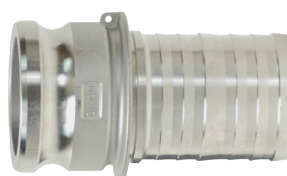
Acero inoxidable 316 de fundición revestida