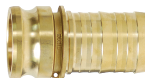
Latón forjado C38000