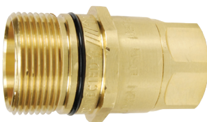
El niple no incluye la brida