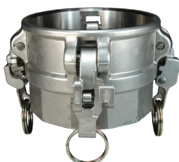
Acero inoxidable 316 para trabajo pesado