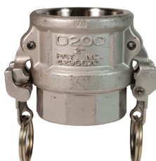
Acero inoxidable 316