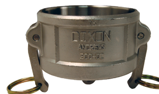
Acero inoxidable 316