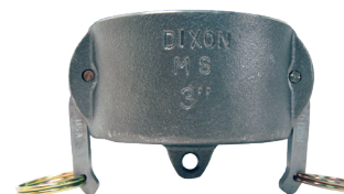
Hierro maleable sin platinar